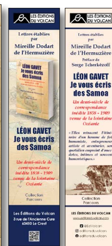
Marque-pages R o et V o